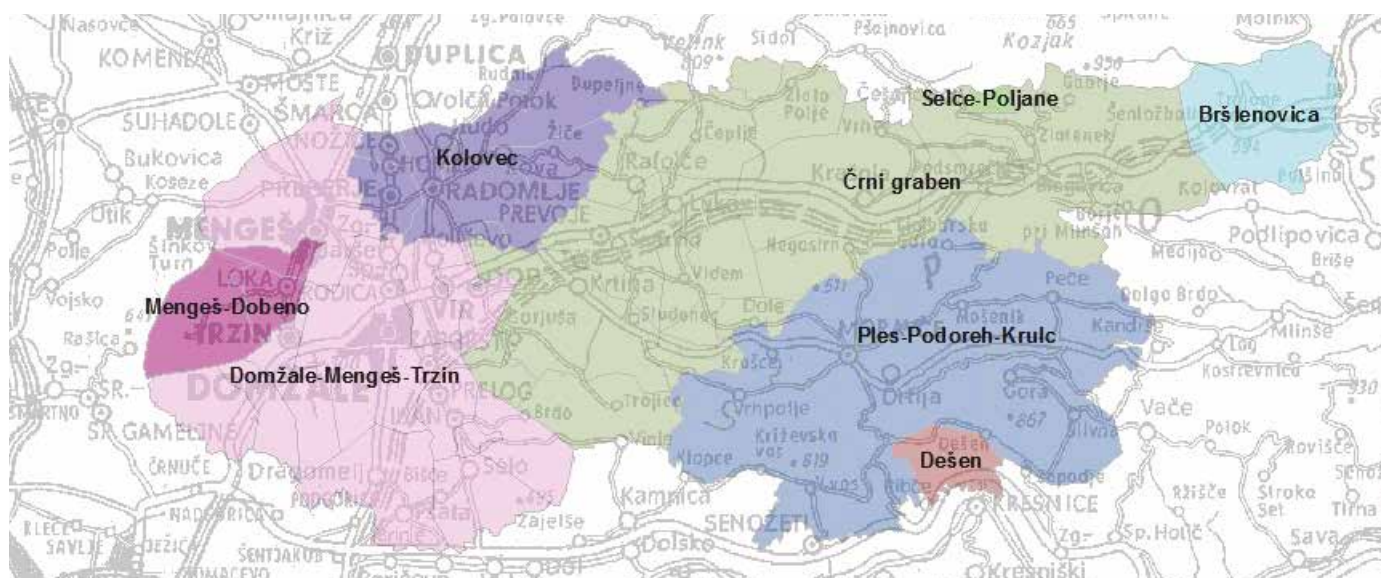
Slika prikazuje osem oskrbovalnih območij, ki so določeni glede na geografsko lego. Prebivalci na teh območjih se oskrbujejo s čisto pitno vodo iz vodnih virov v upravljanju Javnega komunalnega podjetja Prodnik.

V okviru notranjega nadzora so določena stalna odzemna mesta, ki omogočajo celovit nadzor pitne vode na posameznih delih vodovodnega omrežja. Za mikrobiološke preiskave je bilo v letu 2017 na omrežju in zajetih odvzetih in laboratorijsko preiskanih 568 vzorcev pitne vode: 263 na vodooskrbnem sistemu Domžale, 76 na Kolovcu, 108 na Črnem grabnu, 24 na sistemu Mengeš M1 - Dobeno, 76 na sistemu Ples-Podoreh-Krulc, 8 na Dešnu, 6 na sistemu Selce-Poljane in